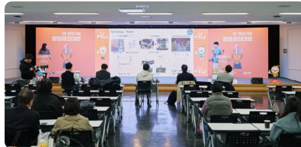
<1인 창조기업 주간행사>